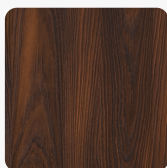
Old Jack S013 Yosemite Tekstura powierzchni Yosemite