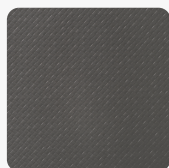
Metalizzato FB35 Mosaico Tekstura powierzchni Mosaico