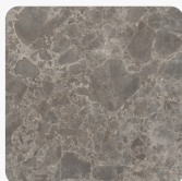
Marmur Siena Szary F095 ST87 Tekstura powierzchni Ceramiczna