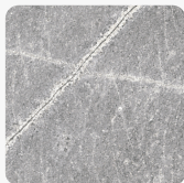
Marmur Atlantycki Szary K368 PH Tekstura powierzchni Palazzo Touch