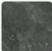
Beton Czarny K205 RS Tekstura powierzchni Kamień