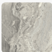
Marmur Cipollino Białoszary F092 ST15 Tekstura powierzchni Biurowa