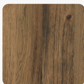
Attic Wood H1400 ST36 Tekstura powierzchni Brushed Wood