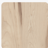
Klon Twardzielowy H111 ST12 Tekstura powierzchni Omnipore Mat