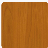
Wiśnia H1706 ST15 Tekstura powierzchni Biurowa