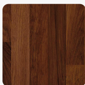
Afzelia Butcherblock H0178 ST15 Tekstura powierzchni Biurowa