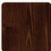
Dąb Thermo H1129 ST15 Tekstura powierzchni Biurowa