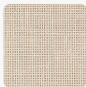
Len Beżowy F425 ST10 Tekstura powierzchni Rustykalne Pory