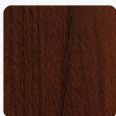
Mahoń Sierra H3080 ST15 Tekstura powierzchni Biurowa