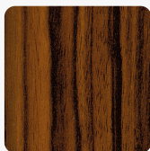
Makassar H3025 ST15 Tekstura powierzchni Biurowa