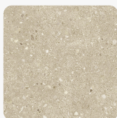
Stonehaven K705 PN Tekstura powierzchni Pluton