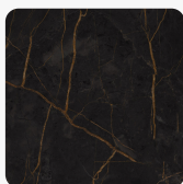
Nero Bronzo K698 PN Tekstura powierzchni Pluton