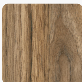
Orzech Mystic M9334 SPT Tekstura powierzchni Spirit