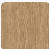
Dąb Primavera Słomiany K695 PV Tekstura powierzchni Primavera