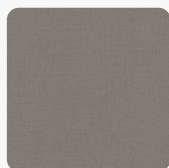
Len Antracytowy F433 ST10 Tekstura powierzchni Rustykalne Pory