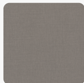
Len Antracytowy F433 ST10 Tekstura powierzchni Rustykalne Pory