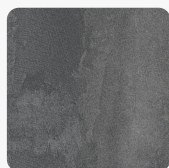
Beton Ciemny K352 RT Tekstura powierzchni Rust