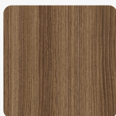
Orzech Franklin Karmel K546 RW Tekstura powierzchni River Wood