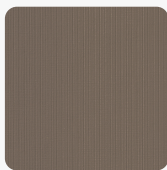
Paglia FD02 Tekstura powierzchni Paglia