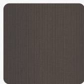
Paglia FC92 Tekstura powierzchni Paglia