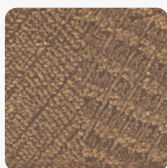
Dąb Halifax Cynowany H3176 ST37