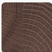
Dąb Gladstone Tabak H3325 ST28