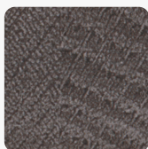
Dąb Sherman Antracytowy H1346 ST32