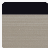
Tekstura powierzchni Doppia