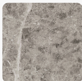
Marmur Szary Emperador K093 SL Tekstura powierzchni Slate