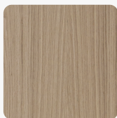
Tekstura powierzchni Fornir