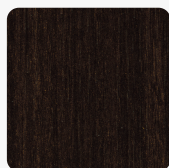
Eukaliptus Ciemnobrązowy H3043 ST12 Tekstura powierzchni Omnipore Mat