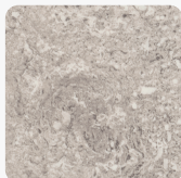
Trawertyn Calais F052 ST75 Tekstura powierzchni Mineral Satin