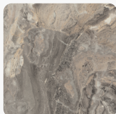
Marmur Cipollino Szary F093 ST7 Tekstura powierzchni Smoothtouch Fine Pearl