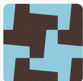
Pepita Zielonobrzazowa D0015 ST15 Tekstura powierzchni Biurowa