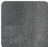
Beton Ciemny K352 RT Tekstura powierzchni Rust