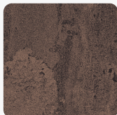
Beton Rdzawy K351 RT Tekstura powierzchni Rust