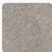
Gołębi Ciemny K550 SL Tekstura powierzchni Slate