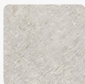
Gołębi Jasny K549 SL Tekstura powierzchni Slate