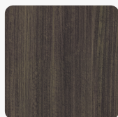
Patrese LR28 Sable Tekstura powierzchni Sablé