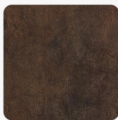
Etna FB43 Ares Tekstura powierzchni Ares