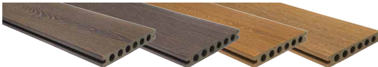
Chestnut strona strukturyzowana