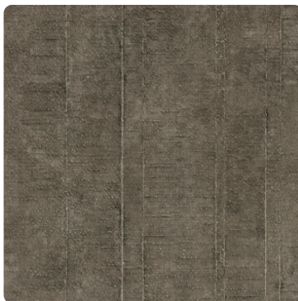
Kliknij, aby powiększyć