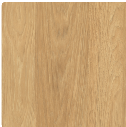
Kliknij, aby powiększyć