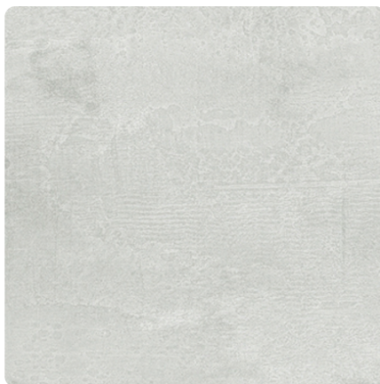
Kliknij, aby powiększyć