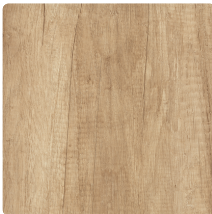
Kliknij, aby powiększyć