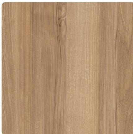
Kliknij, aby powiększyć