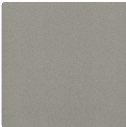
Kliknij, aby powiększyć