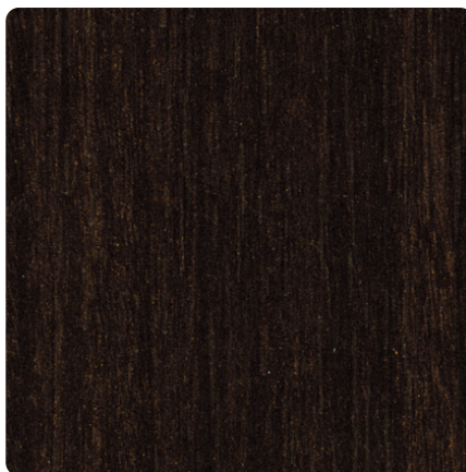
Kliknij, aby powiększyć