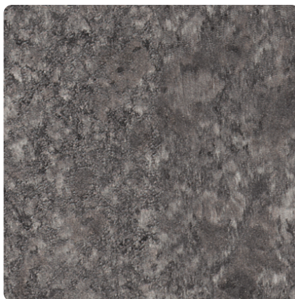
Kliknij, aby powiększyć