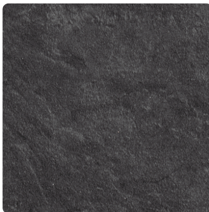
Kliknij, aby powiększyć