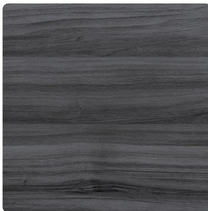
Kliknij, aby powiększyć