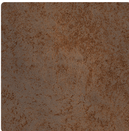
Kliknij, aby powiększyć